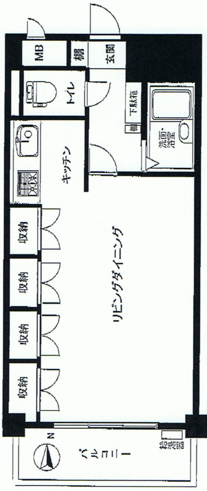
(この図面は概略図で現状と異なる場合があります)

新規内装リフォーム システムキッチン交換 2点ユニット交換 ウォッシュレット交換 クロス天井床 ハウスクリーニング他(平成20年4月)